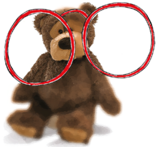
ORA SI' CHE VEDEVA BENE ANCHE PEPE!