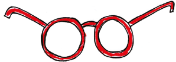
UN BEL PAIO DI OCCHIALINI ROSSI.