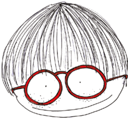
QUESTO ORA E' IGNAZIO.