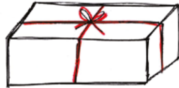
QUANDO ERA MOLTO PICCOLO RICEVETTE DA BABBO NATALE