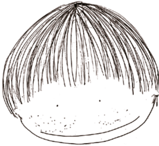
QUESTO E' IGNAZIO.