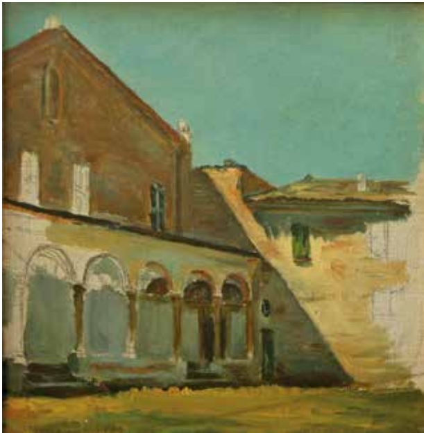
Chiesa romana - Olio su cartone (18 x 18,5) Coll. privata