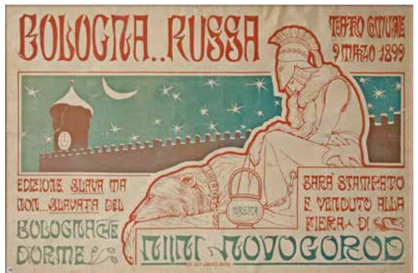
Marzo 1899 Bologna... russa - Manifesto (96 x 64) Collezione privata