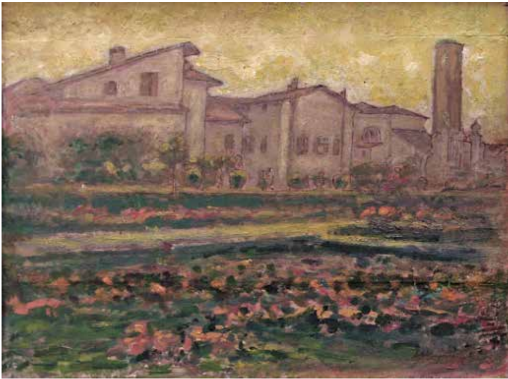
Case di Buttrio - Olio su tela (40 x 30) Collezione privata