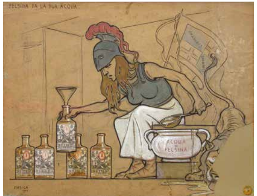
Felsina fa la sua acqua - Tecnica mista 1904 (40 x 30) Collezione privata