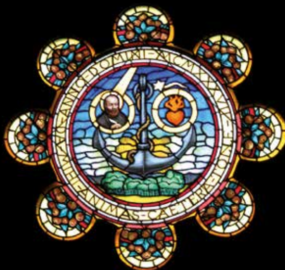
Particolari delle vetrate della cappella dedicata a San Giovanni Bosco, su disegno di Augusto Majani, Bologna, chiesa del Sacro Cuore. In alto a sinistra: Fides et Caritas; in basso a sinistra: Emblema salesiano.