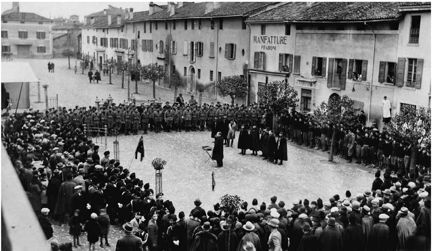
26 Celebrazione della Vittoria in un anno prossimo al 1930, un avvenimento sempre molto sentito dal popolo. E' un'occasione in cui il Regime esibisce la sua forza militare e politica. Inquadri e in armi risaltano i militi della MVSN, molti dei quali già componenti delle squadre punitive del pre-fascismo e repressive poi.

Il volume in esame è strutturato in 11 capitoli (più una corposa e utilissima appendice di immagini, documenti ed elenchi), con sintetici inquadramenti storici introduttivi, che facilitano la contestualizzazione degli avvenimenti locali. Nella sua breve «Premessa», l'Autore presenta la sua opera come una «storia paesana», non avulsa, però, dai «contesti regionali e nazionali». Definizione, forse, un po' riduttiva, soprattutto a causa di quel termine «paesana», che potrebbe far pensare a quadretti di vita locale più o meno folcloristici, mentre invece di storia «vera», sociale e politica, si tratta. Una storia che ha come protagonista il «microcosmo» medicinese, non chiuso in se stesso, ma mostrato via via nei suoi rapporti sempre più ampi e originali con la «grande» storia degli anni del fascismo, della guerra e della Resistenza.