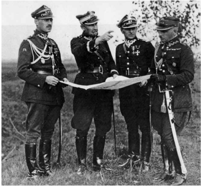
Władysław Anders studente a Riga nel 1913 Il Colonnello Anders, primo a sinistra, nel 1925 durante le manovre Anders a cavallo poco dopo la promozione a generale