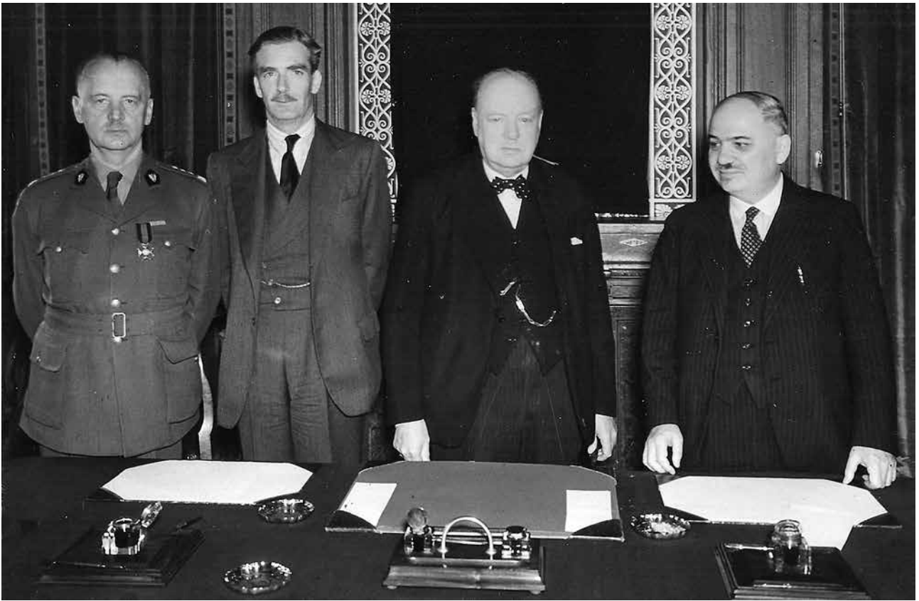
Londra - 30 luglio 1941. Il gen. Sikorski, il Ministro degli esteri Eden, il Primo Ministro Churchill e l'ambasciatore russo Maisky, firmano l'accordo russo-polacco per la liberazione dei prigionieri polacchi in Russia